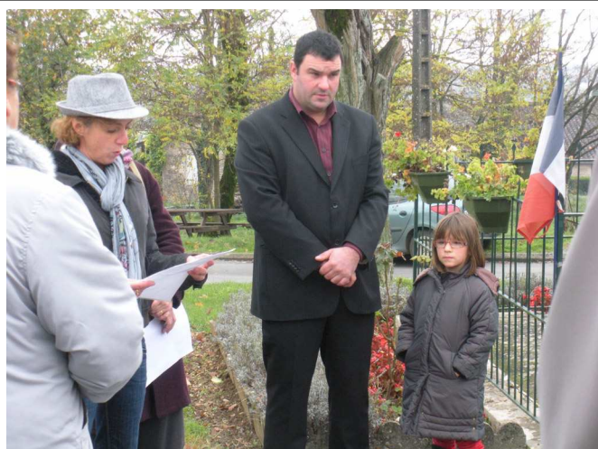
COMMEMORATION DU 8 MAI