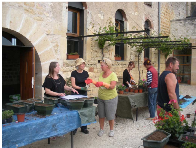
FLEURISSEMENT DU VILLAGE