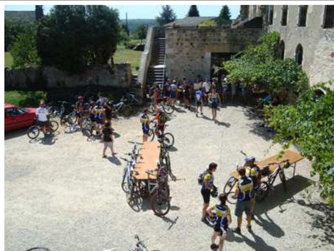
RANDONNEE VTT ET PEDESTRE