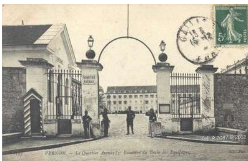
La caserne de Vernon