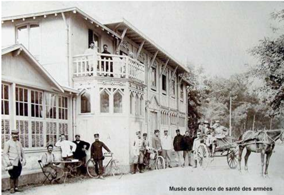
Hôpital complémentaire n° 53 des Sables d'Olonne