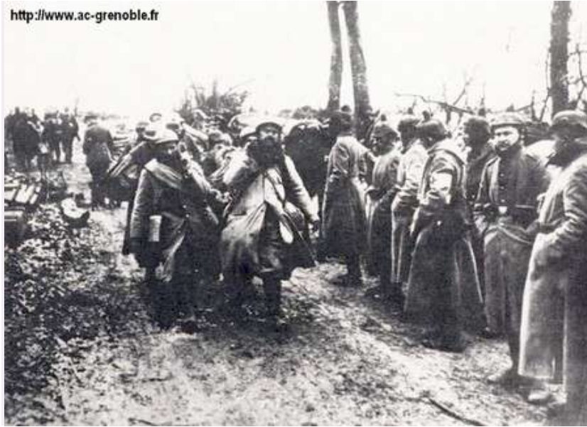
Prisonniers français dans un camp en Allemagne en 1916