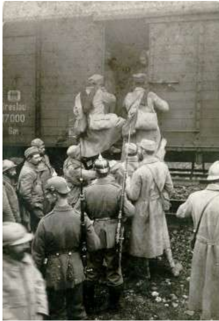
1916 - Prisonniers français montant dans un wagon sous la garde de soldats allemands, fusil à l'épaule.

Ces prisonniers français sont évacués vers l'Allemagne où ils seront maintenus en détention dans des camps jusqu'à la fin du conflit.