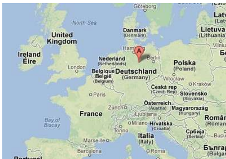
Localisation du camp de Hesseltingen

C'est dans le camp de HESSLINGEN, un "détachement de travail", où il travaille dans les mines, qu'il tombe malade et meurt le 11 mai 1916 d'une embolie.