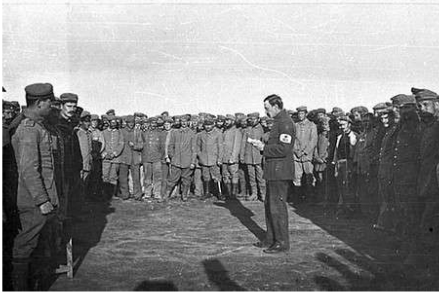
Un délégué du CICR visite un camp de prisonniers de guerre allemands.